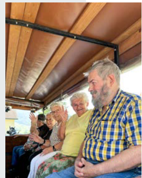
Die Bewohnerinnen und Bewohner freuten sich über die besondere Abwechslung.

Bei herrlichem Sonnenschein konnten die Bewohnerinnen und Bewohner am 19. August 2025 eine Fahrt im Pferdewagen geniessen. In gemächlichem Tempo ging es mit dem Dreispänner der Familie Nussbaumer durchs Dorf Steinen und die nähere Umgebung. Dabei gab es so einiges zu sehen und zu erzählen. Schön wars!