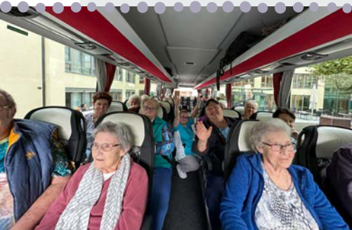
Alle freuen sich über den Ausflug...