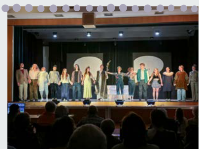
Die Aufführung war traumhaft schön – herzlichen Dank.