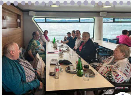
...geniessen die Schifffahrt...