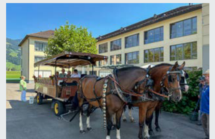
Mit drei PS und gemütlichem Trott war die Fahrt im Pferdewagen ein Genuss.

Ein grosses Dankeschön geht ans Team Admin fürs Organisieren und an alle Begleitpersonen, insbesondere an die freiwilligen Betreuerinnen.