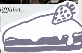
...und auch ein feines Stück Torte darf nicht fehlen.